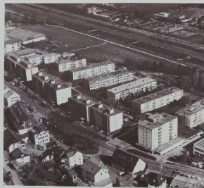
Лейррах, Жилой комплекс "Тайхматтен": Конец 1960-х