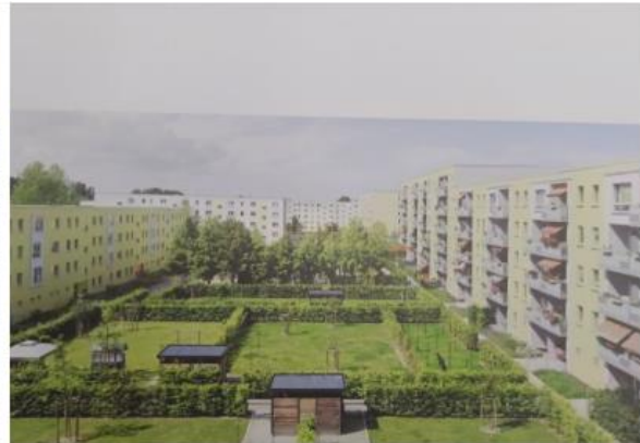
ал Остзее, Грайфсвальд даря работе с рельефом и установке лифтов было ество подходящих квартир для пожилых людей и л идных колясках. Это дает старшему поколению увер что они могут до конца жизни жить в этом районе.