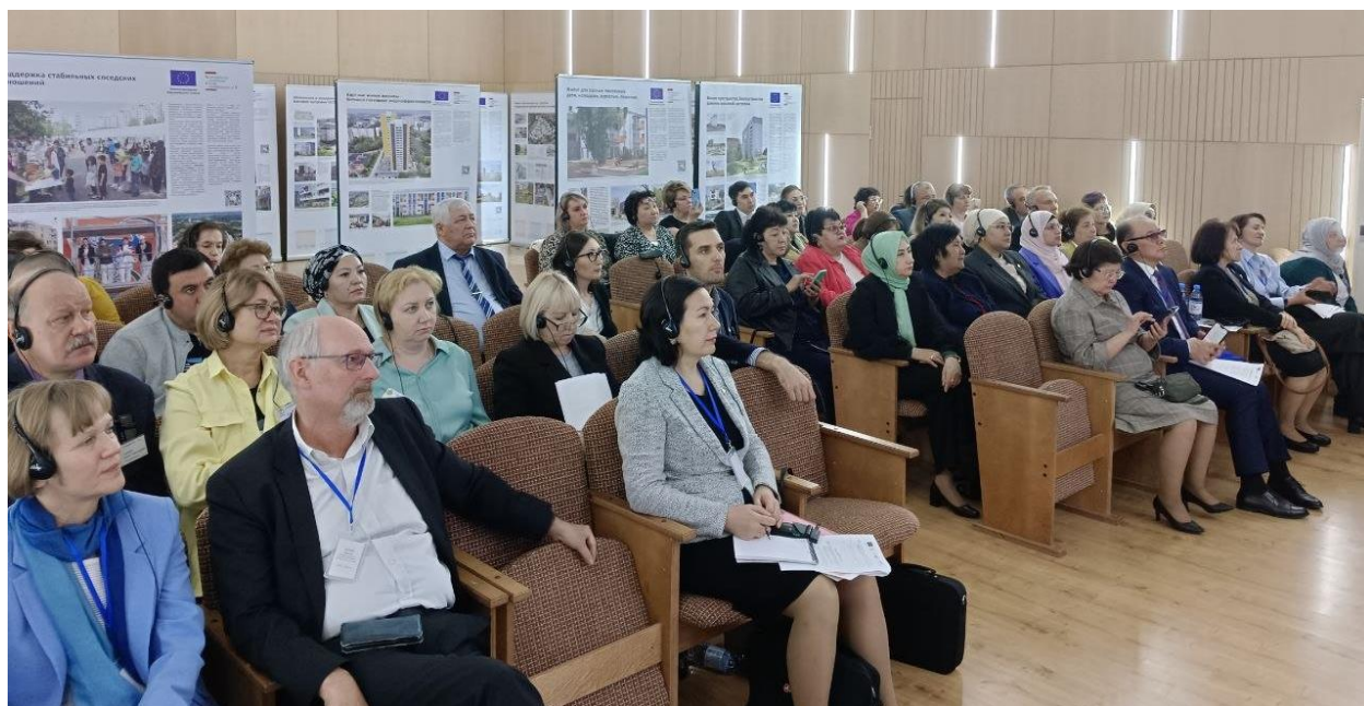
Участники конференции.

И немецкие гости уверены, что в Алматы и других казахстанских городах стоит делать точно так же. Евросоюз готов поделиться не только опытом, но и деньгами. Главное — активное участие граждан и содействие местных властей.