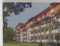
Модернизация по стандарту низкого энергопотребления. Потребность в отоплении была снижена с 300 кВт ч /м2/год до 45 кВт ч/м2/год.