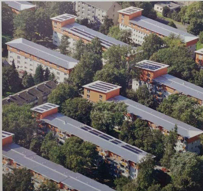
Пример Кельн, поселение Форд: 75 процентов жителей остались жить в поселении после санации.

Соблюдение баланса между экологической необходимостью, экономической осуществимостью и социальной оправданностью, представляет собой большой вызов для энергетической санации и модернизации.