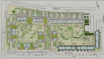
Швед: Реконструкция и дифференцированная модернизация равномерно структурированного жилого квартала: реализация трех строительных этапов с различными жилищными стандартами.