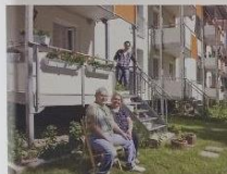
Предложение хорошо используемых открытых пространств было расширено садами для арендаторов, игровыми площадками и местами для встреч.