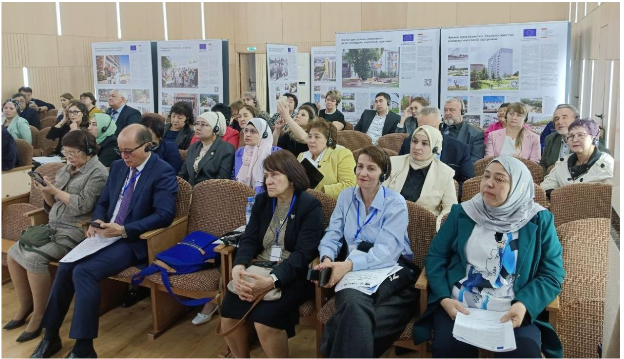
Участники конференции.

Светлана Харитоновна из ОФ «Зелёное спасение» отметила, что сейчас в Казахстане наблюдается хаотичная урбанизация, что сильно вредит окружающей среде. В городах стремительно вырастают многоэтажные жилые кварталы без соблюдения экологических и прочих норм. И они будут потреблять огромное количество ресурсов, так как ресурсосберегающие и энергоэффективные технологии не были внедрены ещё на этапе строительства.