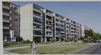
1 этап: Реализация текущих мероприятий по ремонту и модернизации