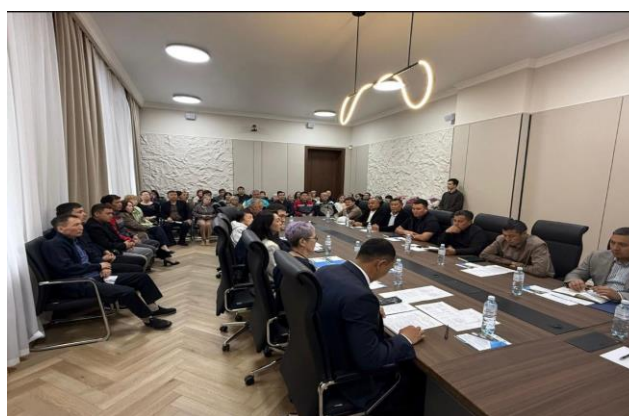
Семинар для управляющих МЖД, представителями завода «Этон» и компанией «Лидер ТС Сервис»

Продолжается взаимодействие и с производителями энергоэффективных решений. По итогам семинара с представителями завода «Этон» достигнуты предварительные договоренности между компанией «Лидер ТС Сервис» и представителями ЖК «Кассина» о комплексном обслуживании котельной, что может способствовать повышению надежности и эффективности теплоснабжения жилого комплекса.