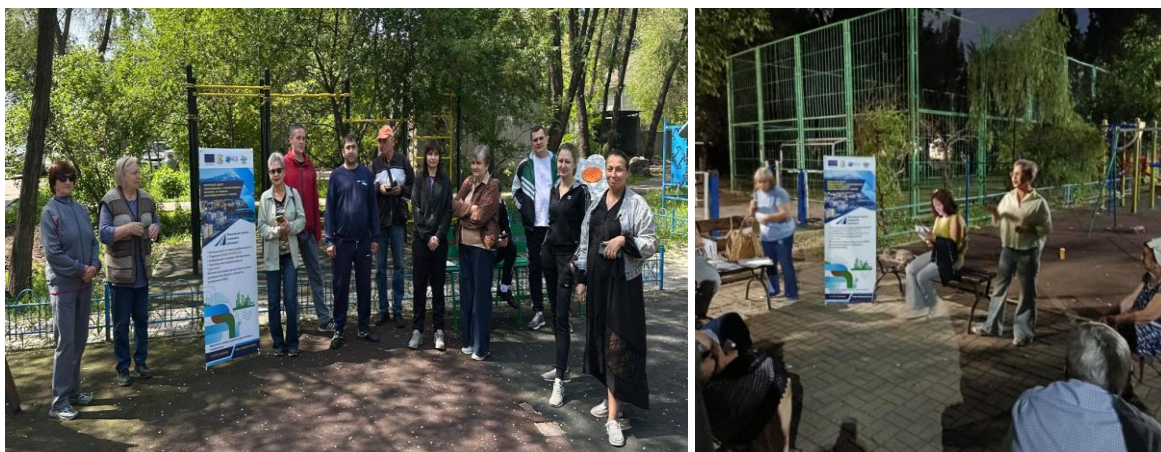
Собрание жителей д.66 ул. Спасская

Важным показателем эффективности информационной работы стали практические действия жителей. За отчетный период собственниками подано 8 заявок на проведение модернизации многоквартирных домов — это превышает показатели предыдущих лет и свидетельствует о росте интереса к вопросам энергоэффективности и долгосрочного содержания жилого фонда.