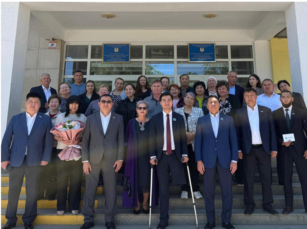
Встреча с Депутатами Маслихата, фото: АКСП «Туран»