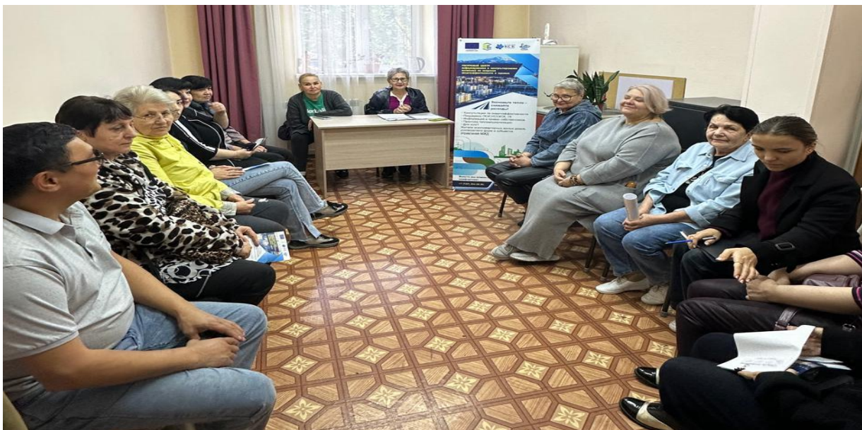
Встреча с активом КСК «Элерон»

Отдельное направление работы было связано с взаимодействием с общественными организациями и социальными институтами. Проведены семинары для Совета ветеранов, социальных работников и актива центра социальной поддержки Ten Qogam . Участники отметили практическую ценность мероприятий и выразили заинтересованность в продолжении сотрудничества, включая проведение дополнительных обучающих программ для советов домов и членов ревизионных комиссий.