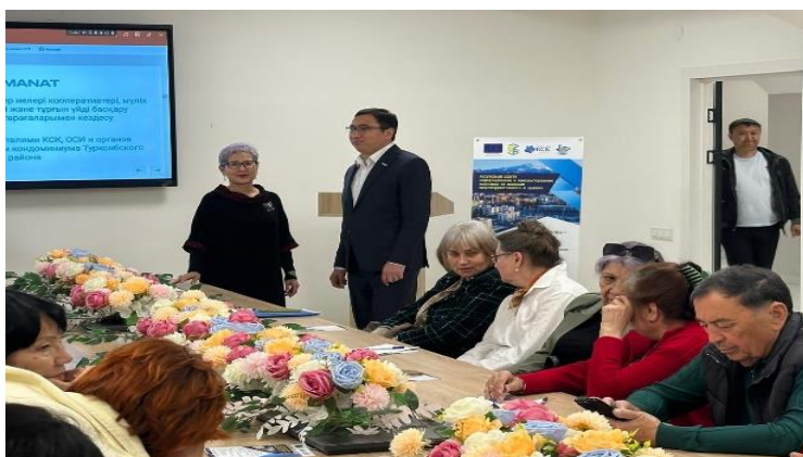
Форум «Турғындар аманаты»

За отчетный период проведено 20 встреч и собраний с собственниками квартир, организованы 4 обучающих семинара для председателей КСК, управляющих компаний и представителей органов управления домами. Дополнительно состоялись 2 рабочих совещания с участием акима и заместителя акима Турксибского района, посвященные вопросам модернизации жилищного фонда и подготовки многоквартирных домов к отопительному сезону.